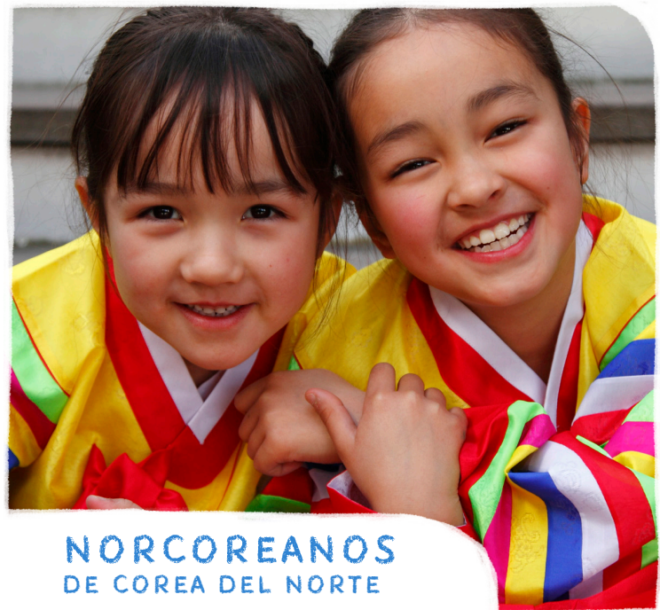
NORCOREANOS DE COREA DEL NORTE

ORA: Para que confiemos solo en Dios como fuente de nuestra provisión y seguridad.