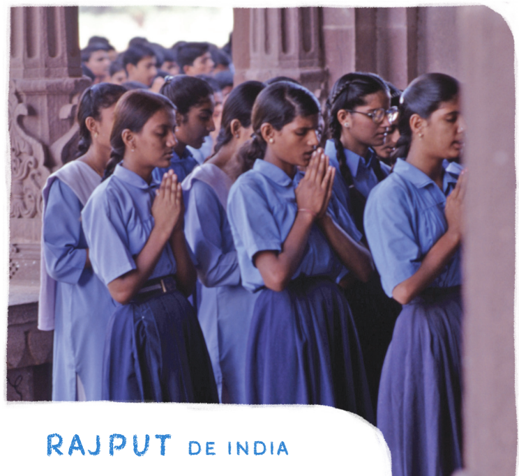
RAJPUT DE INDIA

ORA: Para que confiemos en Jesús para que remueva nuestro pecado y nos de corazones limpios.