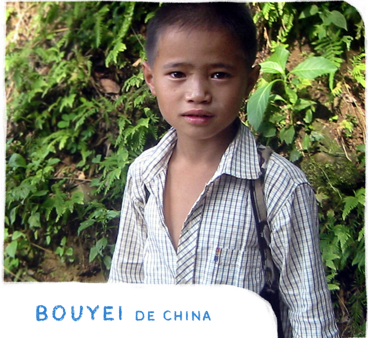
BOUYEI DE CHINA

ORA: Para que Dios remueva el temor de nuestros corazones y lo reemplace con amor y esperanza.