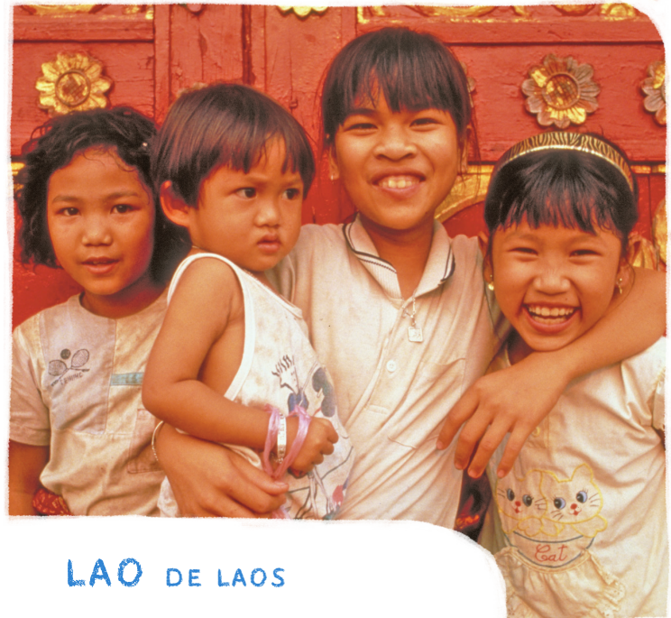
LAO DE LAOS

ORA: Para que entendamos que cuando Jesús viene a nuestros corazones, Dios perdona nuestros pecados pasados.