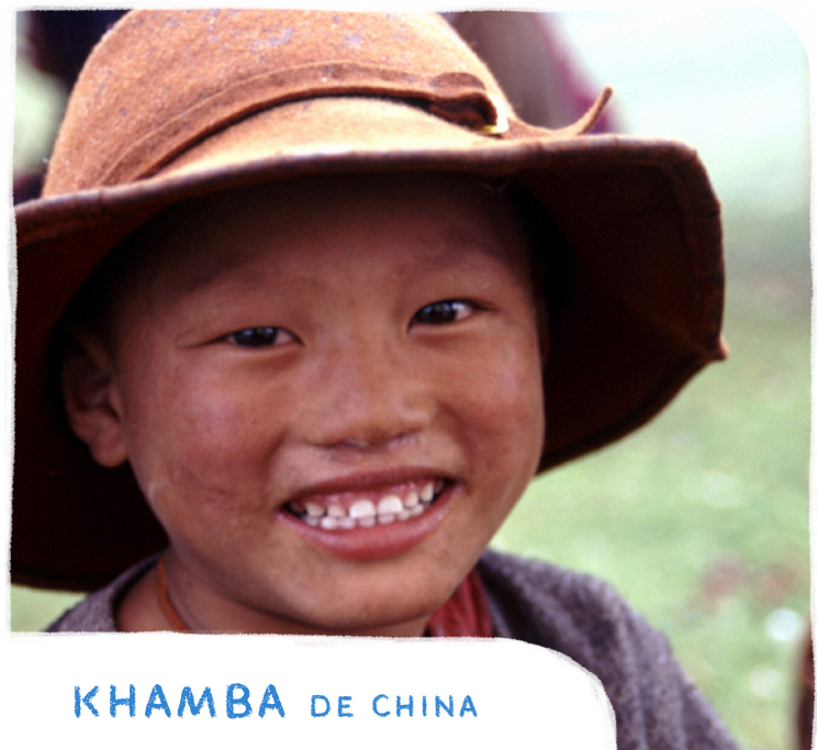
KHAMBA DE CHINA

ORA: Para que escuchemos que Jesús murió en la cruz para darnos su regalo de salvación.