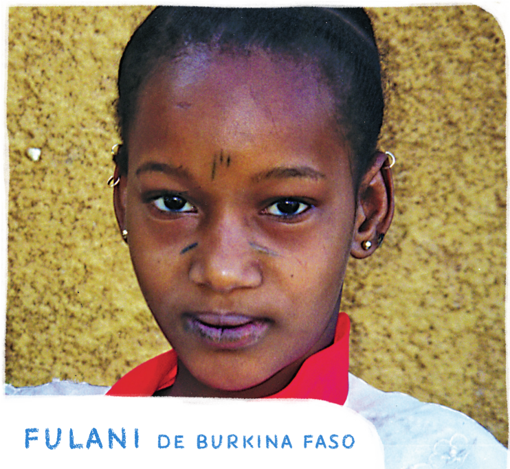
FULANI DE BURKINA FASO

ORA: Para que entendamos que no podemos complacer a Dios con nuestras acciones. Dios debe hacer nuestros corazones correctos ante él.