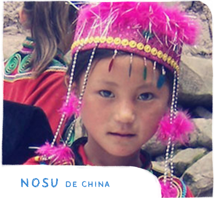
NOSU DE CHINA

ORA: Para que confiemos en Dios, quien creó el universo entero y es más poderoso que los espíritus.