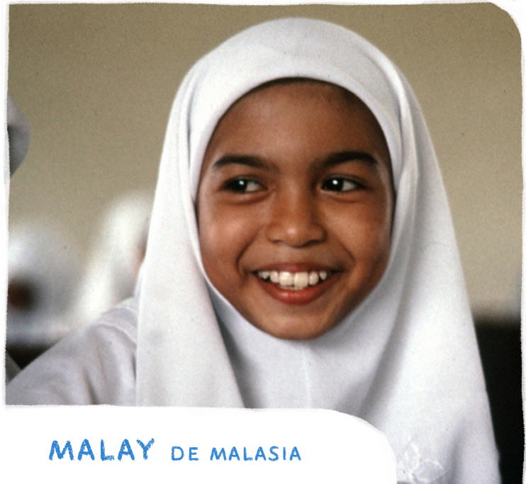
MALAY DE MALASIA

ORA: Para que confiemos que Jesús remueve nuestro pecado, vergüenza y miedo y nos adopta como sus hijos por siempre.