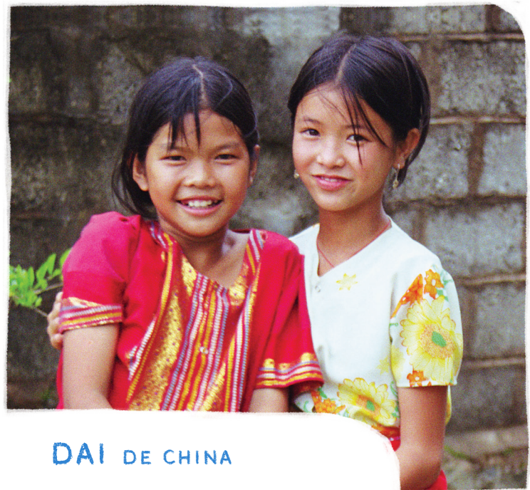
DAI DE CHINA

ORA: Para que escuchemos acerca del plan de Dios para remover el sufrimiento y acercarnos a tener una relación con él.