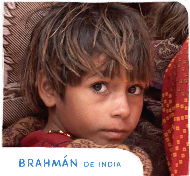
BRAHMÁN DE INDIA

ORA: Para que llegemos a entender que Jesús murió para pagar por nuestros pecados del pasado, presente y futuro.