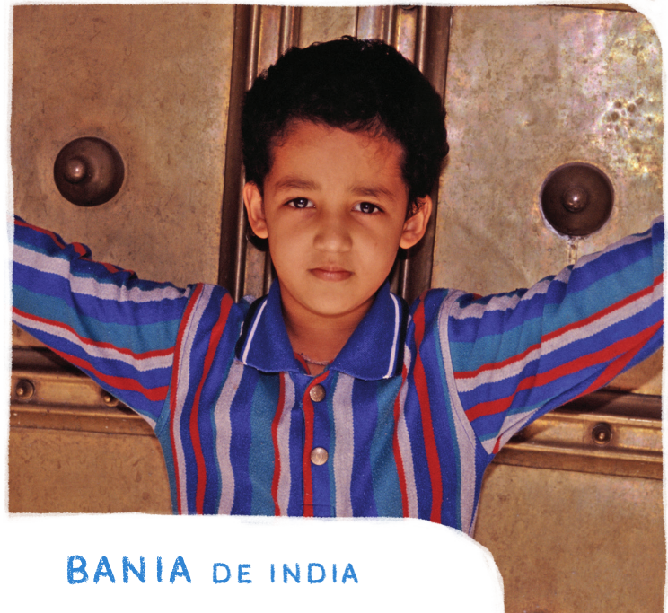
BANIA DE INDIA

ORA: Para que entendamos que Jesús es único, el único que Dios llama igual a sí mismo.