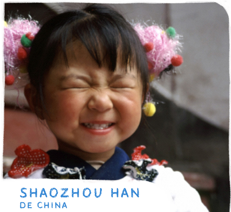
SHAOZHOU HAN DE CHINA

ORA: Para que Dios nos muestre que él es real y que nos creó para amarlo y adorarlo.