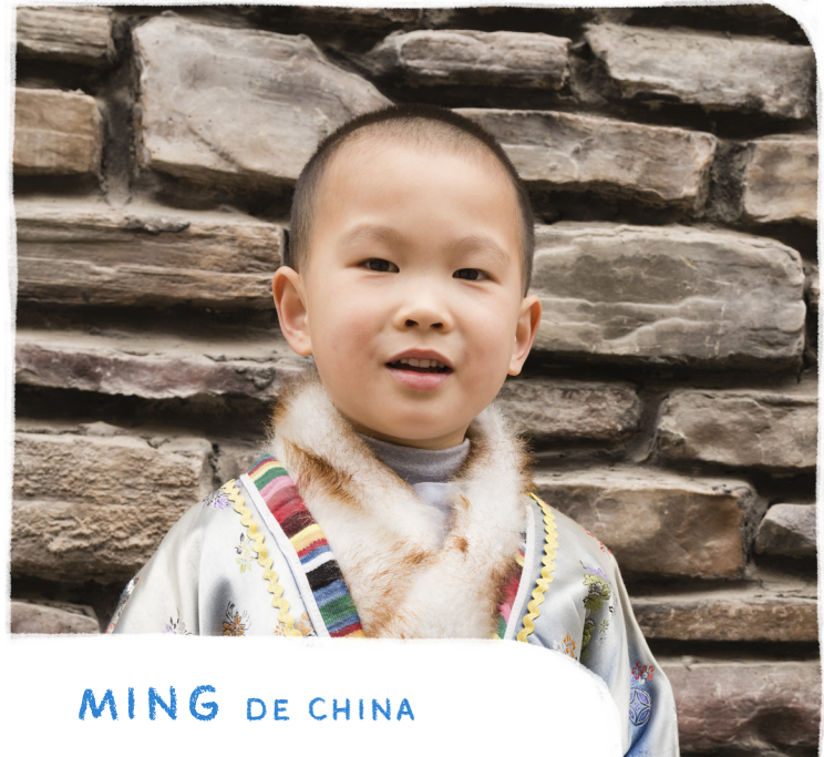
MING DE CHINA

ORA: Para que el único Dios verdadero se revele a sí mismo como real y poderoso.