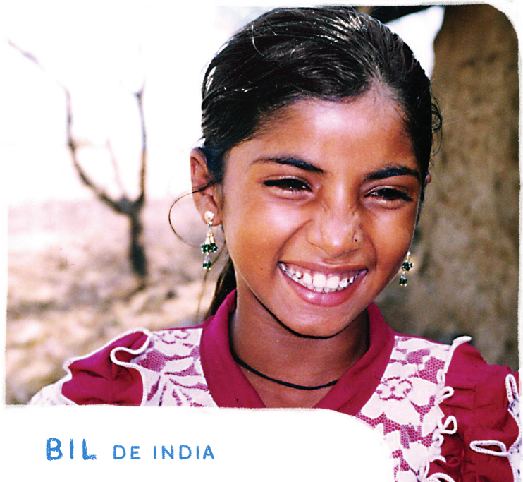
BIL DE INDIA

ORA: Para que lleguemos a conocer al Dios que nos creó y que nos quiere conocer como sus hijos.